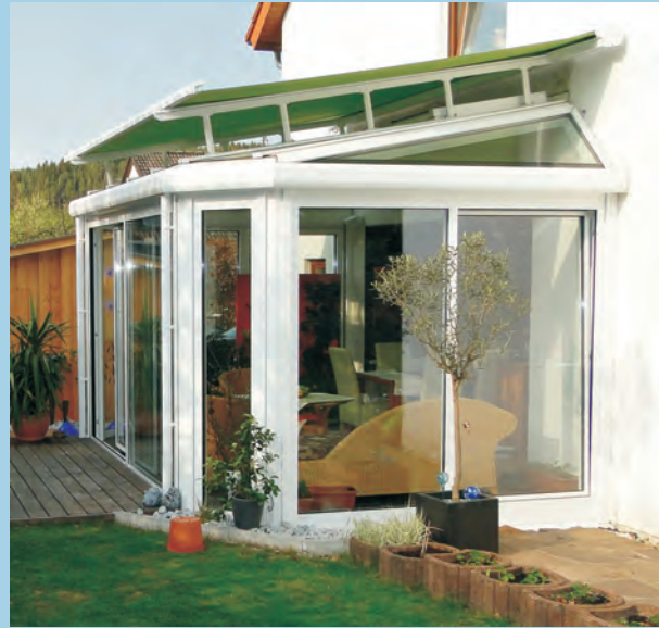
Von der Planung bis zur Fertigung ein Albrecht Wintergarten.